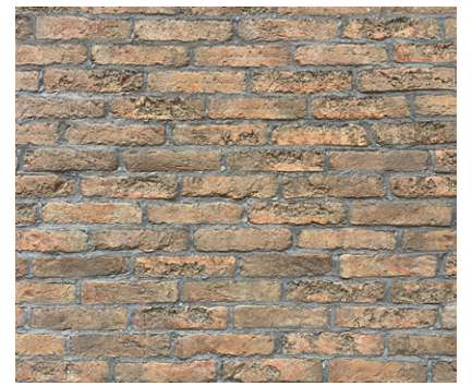
Ton rouge cuivré