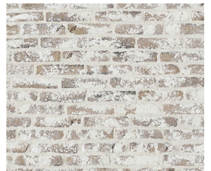
Ton graphite cérusé