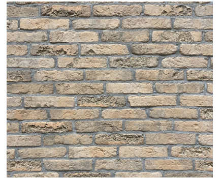
Ton gris rosé