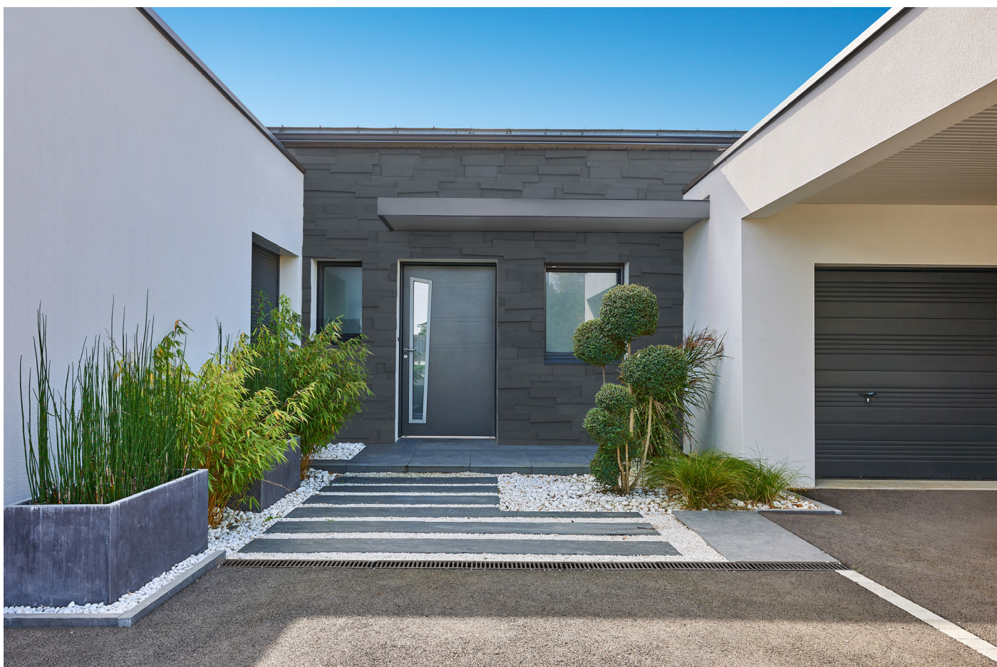
Collection Statur, ton anthracite

Pur et graphique, le nouveau parement mural Statur est composé de plaquettes lisses effet béton, qui créent des lignes et des reliefs équilibrés pour sublimer les façades. Facile à poser, ce parement est idéal pour apporter une touche de modernité à son lieu de vie.