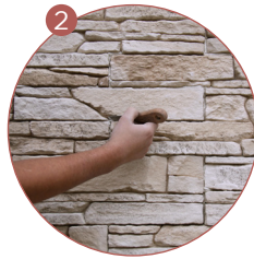
J'élimine le surplus de colle